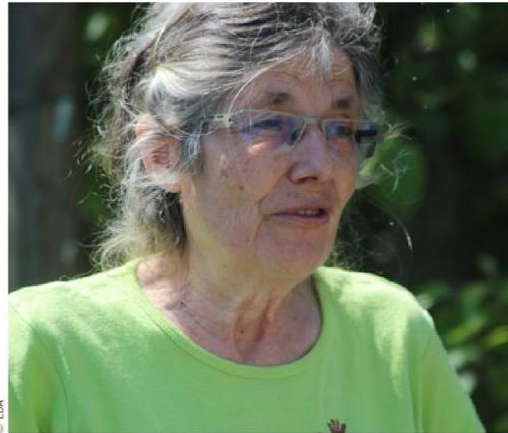
Décédée, l'amoureuse de la nature continue à inspirer...