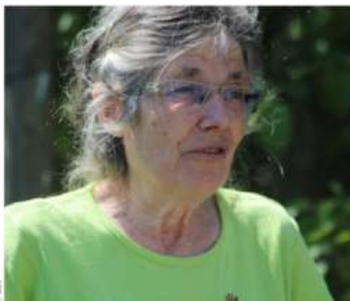
Décédée, l'amoureuse de la nature continue à inspirer...